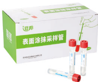
表面涂抹采样管 (含中和剂/不含中和剂)