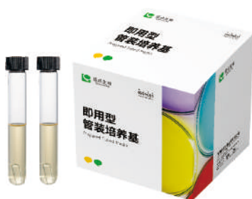
即用型无菌管装培养基