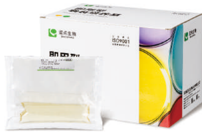
即用型无菌袋装培养基